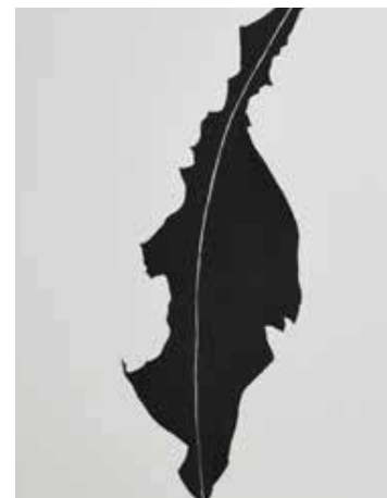
Forma que cai (Série Details), 2020 Desenho de lápis crayon sobre papel montval 300g 39x29.50cm