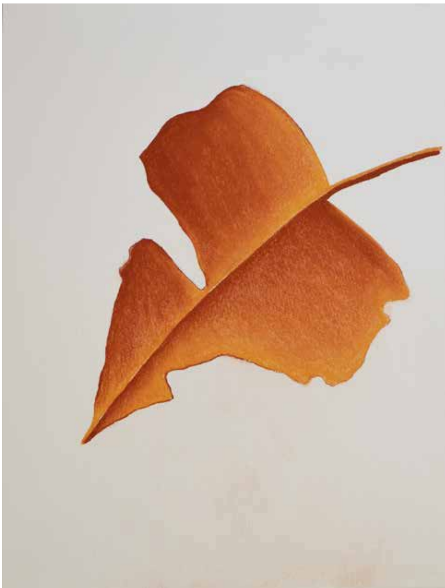
Vibra terra (Série Details), 2020

Desenho de lápis crayon sobre papel montval 300g, 39x29.50cm