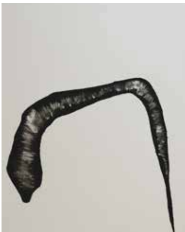
Curvatura (Série Details), 2020 Desenho de lápis crayon sobre papel montval 300g 39x29.50cm