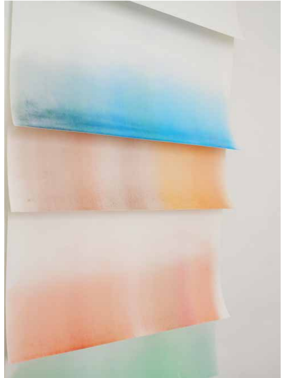
Eco, 2019 Desenho de lápis crayon sobre papel com suporte de madeira, 200x76cm