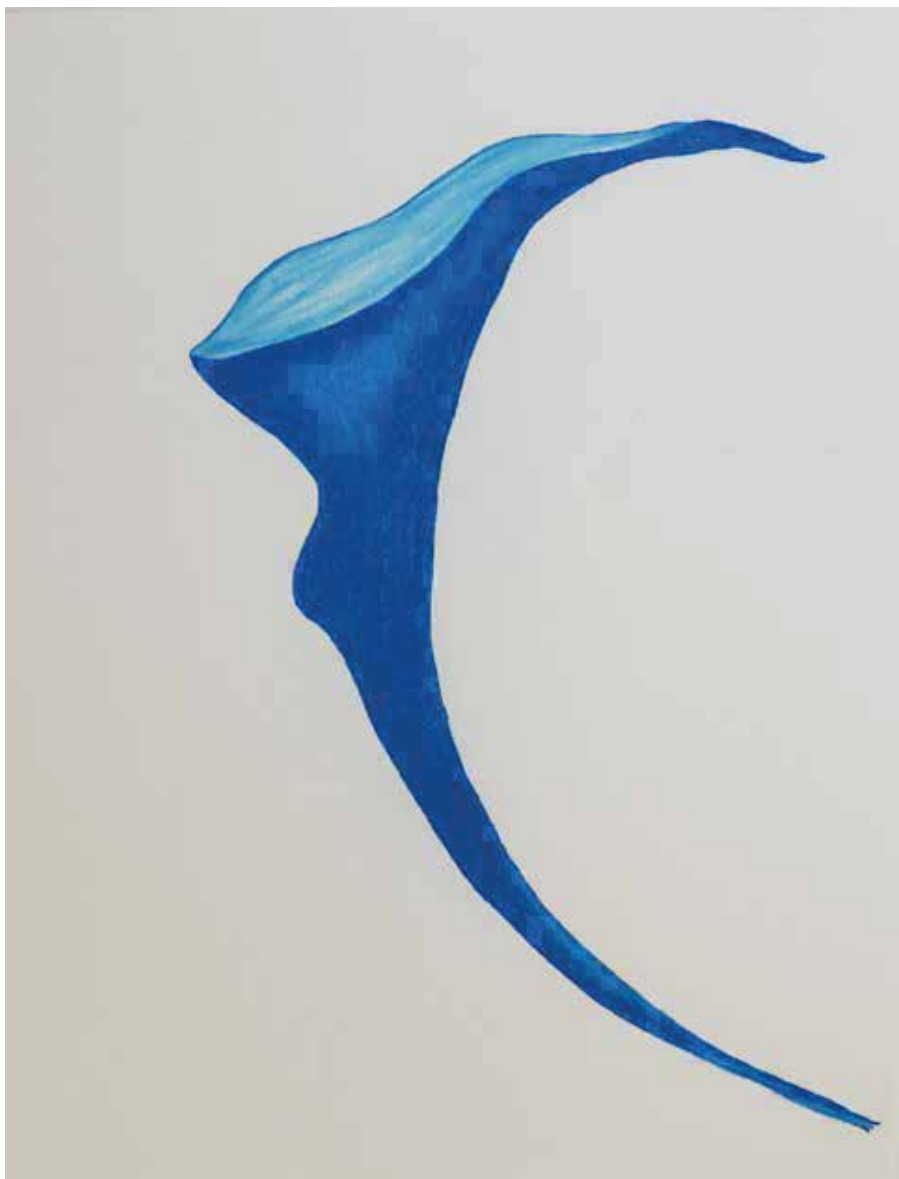
Continente azul (Série Details), 2020

Desenho de lápis crayon sobre papel montval 300g, 39x29.50cm