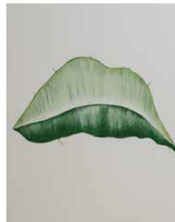
Rebatimento (Série Details), 2020 Desenho de lápis crayon sobre papel montval 300g 39x29.50cm