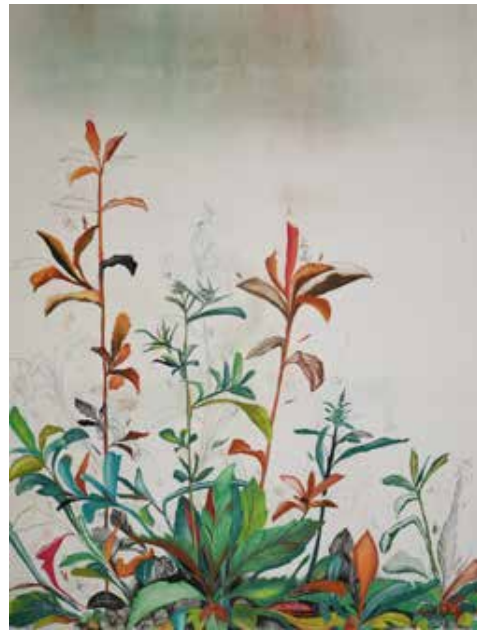
Rio de pedras preciosas, 2020 Crayon sobre papel montval 300g 200x152cm