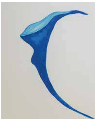
Continente azul (Série Details), 2020 Desenho de lápis crayon sobre papel montval 300g 39x29.50cm