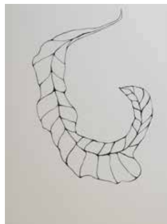
Estrutura (Série Details), 2020 Desenho de lápis crayon sobre papel montval 300g 39x29.50cm