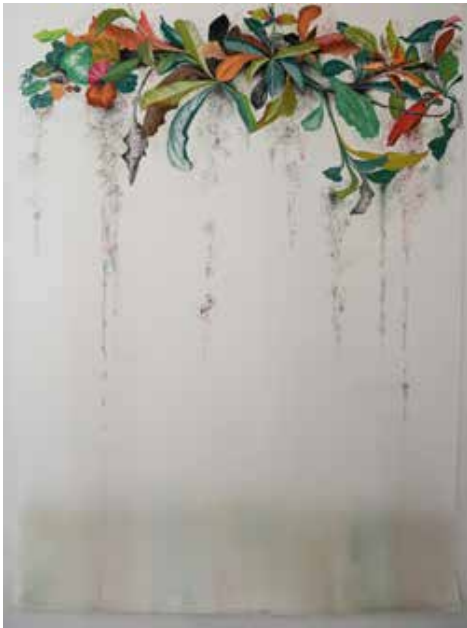
Seberi II, 2020 Desenho de crayon sobre papel montval 300g 198x152cm