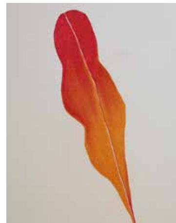
Croma (Série Details), 2020 Desenho de lápis crayon sobre papel montval 300g 39x29.50cm