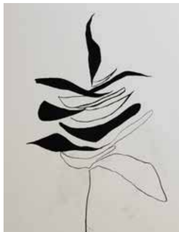
Empilhamento (Série Details), 2020 Desenho de lápis crayon sobre papel montval 300g 39x29.50cm