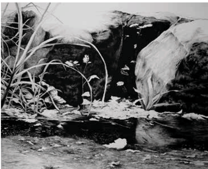
Rua Giordano Bruno, 226, 2015 Desenho de grafite sobre papel montval 300g, 153x190cm