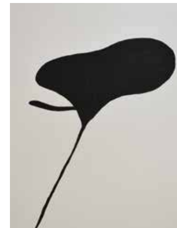
Forma em pb (Série Details), 2020 Desenho de lápis crayon sobre papel montval 300g 39x29.50cm