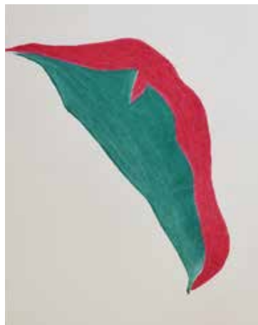
Bica (Série Details), 2020 Desenho de lápis crayon sobre papel montval 300g 39x29.50cm