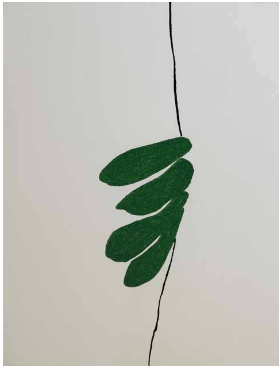
Movimento ascendente (Série Details), 2020

Desenho de lápis crayon sobre papel montval 300g, 39x29.50cm