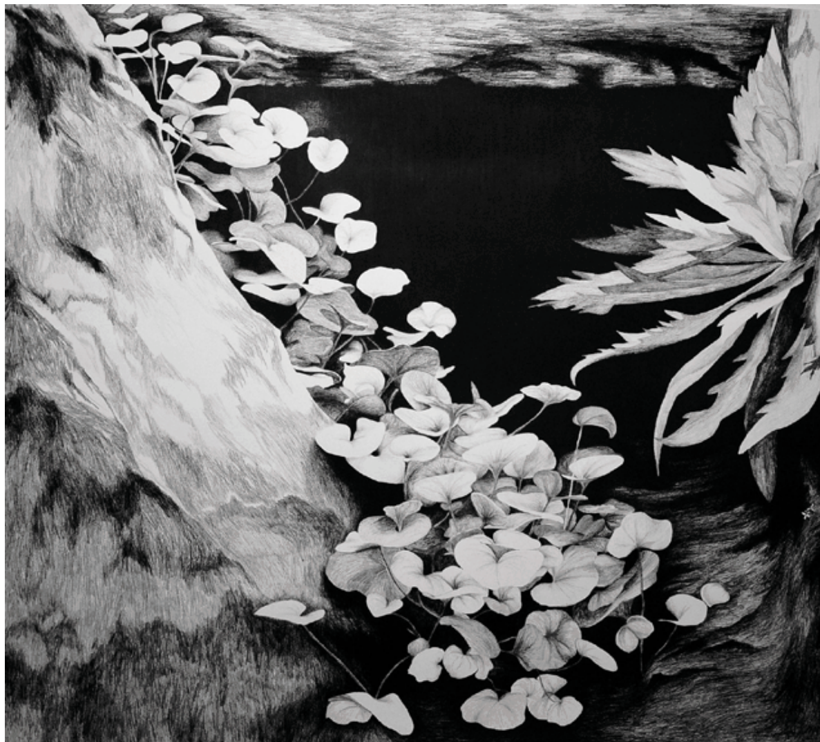
Rua Augusto Pestana, 146, 2015 Desenho de grafite sobre papel montval 300g, 153x170cm